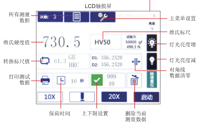
维氏硬度测量软件(标配)