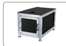
硬度计工作台(选配)